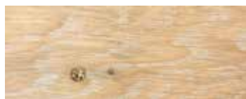
ROVERE CON NODI SBIANCATO CERA · WHITENED OAK WITH KNOTS WAX EICHE MIT KNOTEN GEWEISST UND GEWACHST · CHÊNE AVEC NŒUDS BLANCHI CIRE ROBLE CON NUDOS BLANQUEADO Y ACABADO CERA