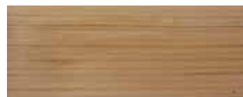
CEDRO · CEDAR · ZEDER · CÈDRE · CEDRO