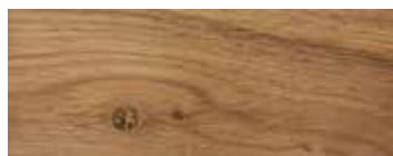
ROVERE CON NODI · OAK WITH KNOTS · EICHE MIT KNOTEN · CHÊNE AVEC NŒUDS ROBLE CON NUDOS