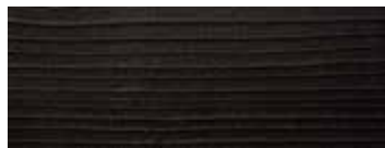
CEDRO VULCANO · VULCANO CEDAR · ZEDER VULCANO CÈDRE VULCANO · CEDRO VULCANO

TOP IN CRISTALLO TRASPARENTE SPESSORE 1,8 CM GAMBA NELLE ESSENZE NOCE CON NODI, ROVERE CON NODI E ROVERE SBIANCATO CON NODI A BLOCCHI INCOLLATI · GAMBA IN CEDRO: IN UN UNICO BLOCCO.